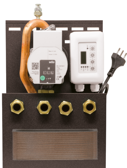
Dimensioni 10 x 25 x 37 cm (PxBxH)