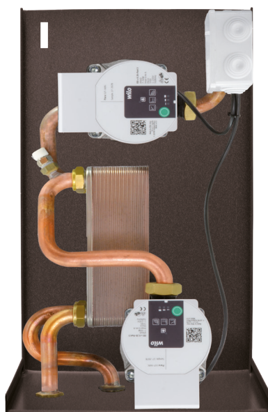
Dimensioni 25 x 30,5 x 51 cm (PxBxH)