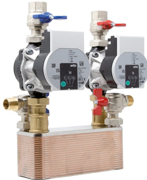
Dimensioni 15 x 35 x 35 cm (PxBxH)