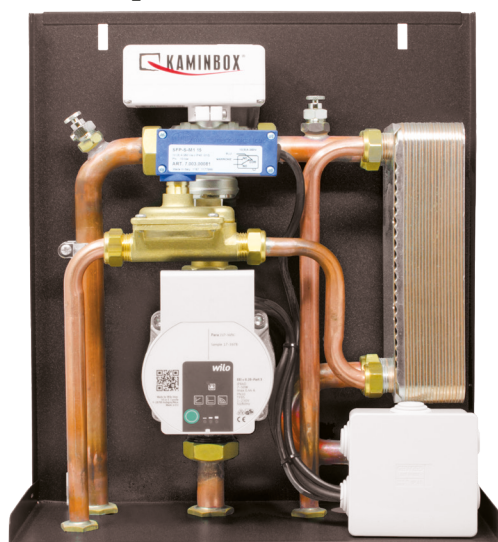
Dimensioni 15 x 44 x 34 cm (PxBxH)